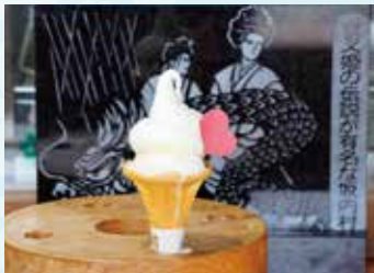
▲地元産の蜂蜜がけソフトクリーム

岐阜県最西端の道の駅で、滋賀県木之本方面へ向かうルート of 県境近くにある「夜叉ヶ池の里さかうち」。2023年秋に揖斐川町と福井県池田町を結ぶ冠山峠が開通となったことから、福井県からの来客も多く訪れる道の駅です。山と川の美しい自然が間近にあり、地域には龍神伝説で知られ、標高1,100mに位置する神秘的な池「夜叉ヶ池」があります。