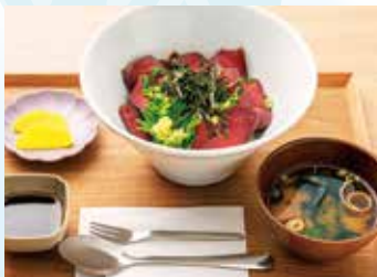
▲鹿肉を使ったジビエステーキ丼

木の温もりを感じる建物には、道路や観光情報を提供する地域ふれあい広場、農林畜水産物販売所、夜叉ヶ池伝説が展示された喫茶&レストランがあります。山並みを望みながらくつろげる喫茶&レストランでは、午前10時半までドリンク代のみでモーニングを提供。みそ汁の優しい香りと味わいに癒やされます。北海道産の生乳をたっぷり使ったソフトクリームもオーダーでき、地元産の濃厚な蜂蜜がけがおすすめです。