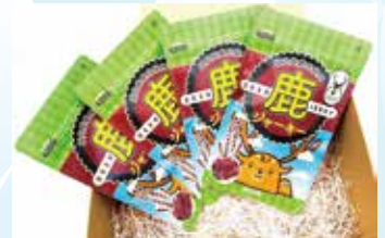
▲人気を集める鹿ジャーキー