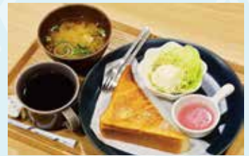
▲ドリンク代だけのモーニング