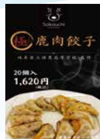
▲高校生が共同開発したギョーザ