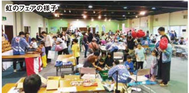
虹のフェアの様子