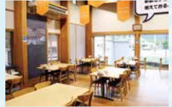
▲明るく広い喫茶&レストラン

他にも夜叉ヶ池伝説にちなんで作られた山芋焼酎や、地域を越えた農水産物や加工品も多彩。伝説のロマンを感じながら、食事や買い物を楽しめる道の駅です。