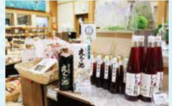
▲地域産の多彩な土産がそろう