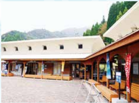
▲伝説が息づく自然に抱かれた施設

住所 揖斐郡揖斐川町坂内広瀬306 TEL 0585-53-2262 HP https://yashaikenosato.com 営業時間 9:00～17:00 (喫茶)9:00～16:00(モーニング 9:00～10:30) (レストラン)11:00～14:00 定休日 水曜(祝日の場合は翌日)・年末年始 アクセス 揖斐川町役場から国道303号線を北西へ約25km