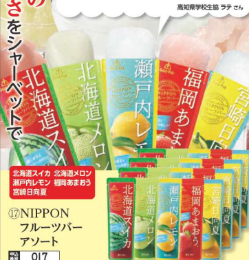
北海道スイカ 北海道メロン 瀬戸田レモン 福岡あまおう 宮城日向夏