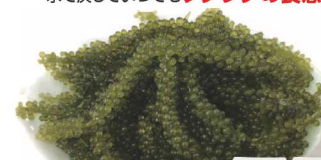
19 沖縄産 海苔どう 塩水漬け 28g×2個)