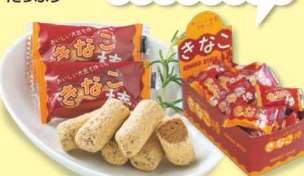
15 おいしい大豆で作った きなこ棒