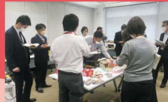
セレクト商品選定会の様子