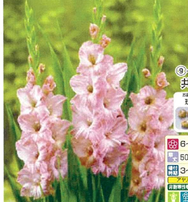
⑩ 切り花向きグラジオラス 桃花種 15球 商品番号 010 本体 580円 (税込638円)