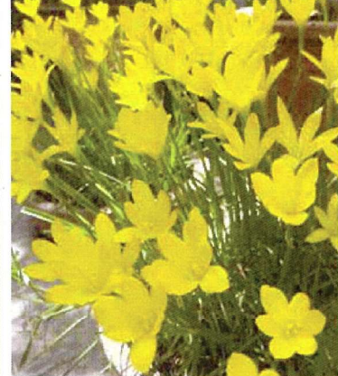
⑳ 毎年花咲く玉すだれ きいろ 25球 商品番号 020 本体 580円 (税込638円)