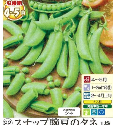
㉒ スナップ豌豆のタネ 1袋 (1袋(10ml)(約20粒)) 商品番号 022 本体 580円 (税込638円)