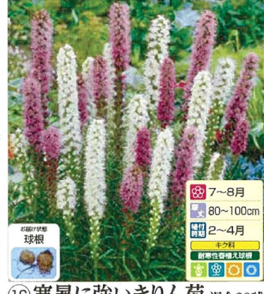
⑯ 寒暑に強いきりん菊 混合20球 (リアトリス 紫系、白系) 商品番号 016 本体 580円 (税込638円)