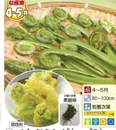
㉔ てんぷらシダ(コゴミ) 1株 商品番号 024 本体 580円 (税込638円)