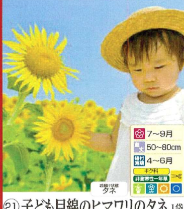
㉑ 子ども目線のヒマワリのタネ 1袋 (ヒマワリ サンスポット1袋(約20粒)) 商品番号 021 本体 580円 (税込638円)