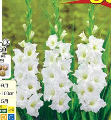
⑪ 切り花向きグラジオラス 白花種 15球 商品番号 011 本体 580円 (税込638円)