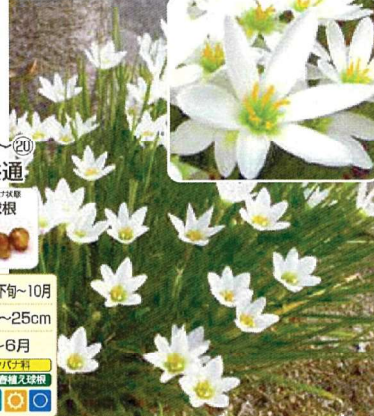
⑲ 毎年花咲く玉すだれ しろ 25球 商品番号 019 本体 580円 (税込638円)