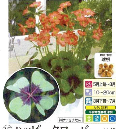
⑮ ハッピークローバー 40球 (オキザリス デッペイアイアンクロス) 商品番号 015 本体 580円 (税込638円)