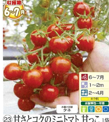
㉓ 甘さとコクのミニトマト 甘っこ 1袋 (ミニトマト甘っこ1袋(10粒)) 商品番号 023 本体 580円 (税込638円)