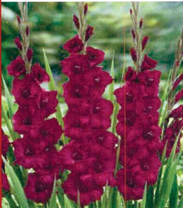
⑬ 切り花向きグラジオラス 紫花種 15球 商品番号 013 本体 580円 (税込638円)