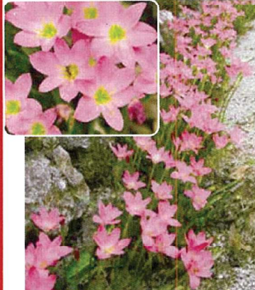
⑰ 毎年花咲く玉すだれ ももいろ 25球 商品番号 017 本体 580円 (税込638円)