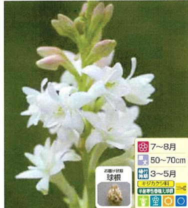
⑭ 甘い香りのチューベローズ 3球 商品番号 014 本体 580円 (税込638円)