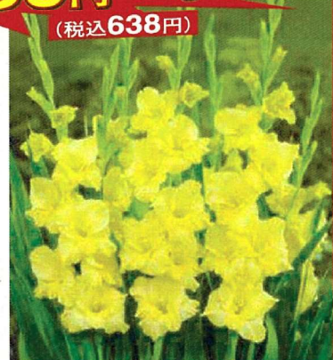
⑫ 切り花向きグラジオラス 黄花種 15球 商品番号 012 本体 580円 (税込638円)